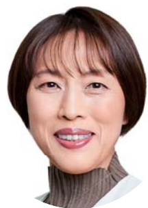
田村 智子 党委員長・参議院議員