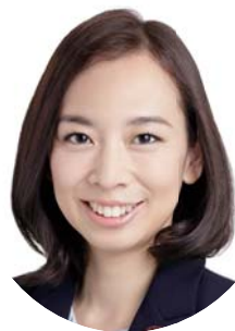
吉良よし子 参議院議員(東京)